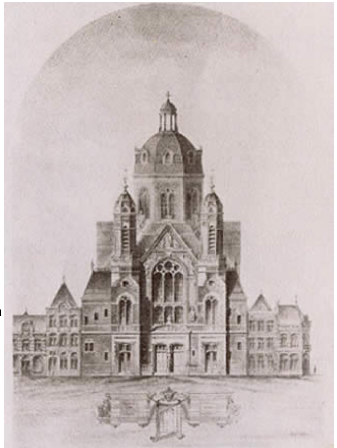
De 19de eeuwse Cyriacus- Franciscuskerk