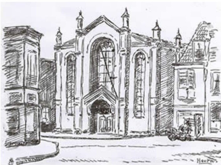
De voormalige Doopsgezinde Kerk