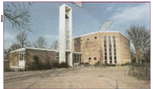
Kerkelijk Centrum "Het Oktaaf"

Intussen zijn er in Hoorn twee moskeeën . Eerder was er al een in een primitieve behuizing aan de Pakhuisstraat maar sinds 1991 hebben de Turkse moslims een prachtig gebouw (met veel gastvrijheid en een vriendelijke moskeewinkel) aan de Vredenhofstraat. De meer besloten Marokkaanse moskee (Alfath) is rond 1992 ondergebracht in een inmiddels verbouwde school aan de Joh. Poststraat. Elke vrijdag en vooral in de Ramadanmaand is het er een drukte van belang.